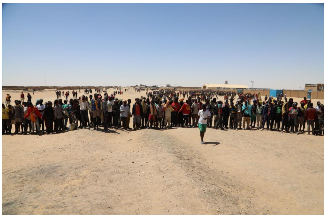
Assamaka : des migrants arrivés d'Algérie dans le village d'Assamaka.

Les mêmes autorités avaient déjà convoqué une réunion d'urgence vendredi 31 mars 2023. En marge de cette rencontre, une autre réunion entre les agences des Nations Unies présentes à Agadez s'est tenue le lundi 3 avril et un comité des acteurs intervenants dans la région d'Agadez a été mis en place pour rencontrer les autorités régionales dans le cadre de la recherche de solutions à la crise ainsi née.